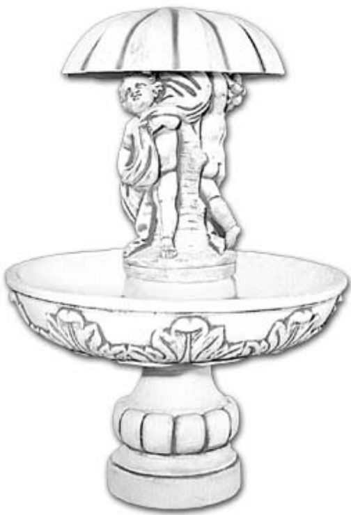
Схема сборки фонтана артикул 851