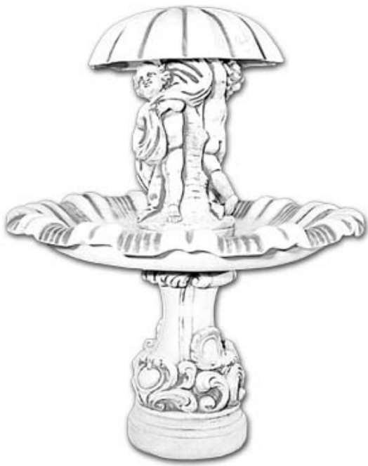
Схема сборки фонтана артикул 921